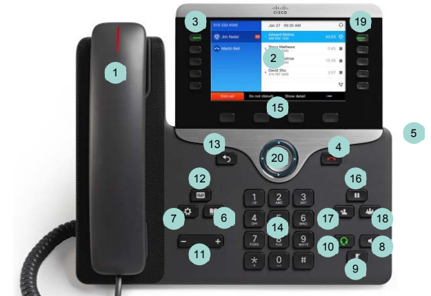
Abbildung: Modell 8841 (8851 ähnlich)